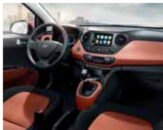
Černá / oranžová