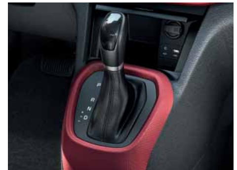
4stupňová automatická převodovka. Automatická převodovka s plynulým řazením Vám usnadní jízdu v hustém městském provozu.