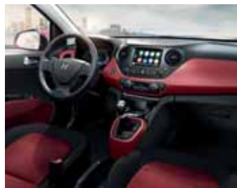
Černá / červená