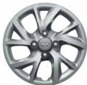
14" ocelová kola s celoplošným krytem