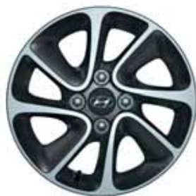
14" kola z lehkých slitin