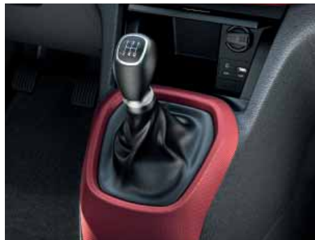
5stupňová manuální převodovka. Precizní řazení poskytuje ještě větší potěšení z jízdy, zejména při jízdě mimo město.

Kultivované motory a převodovky poskytují výkony, které potřebujete, a to v kombinaci s nízkou spotřebou paliva i nízkými emisemi. Na výběr máte zážehový tříválec 1,0/48,5 kW, čtyřválec 1,2/63,8 kW a verzi motoru 1,0l s pohonem na LPG o výkonu 49,3 kW. Motory jsou doplněny buď precizní 5stupňovou manuální převodovkou nebo 4stupňovou automatickou převodovkou s plynulým řazením. Páka voliče je umístěna v praktické, vyšší poloze pro snadné ovládání.