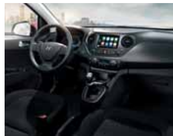
Černá / tmavošedá