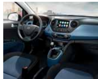
Černá / modrá