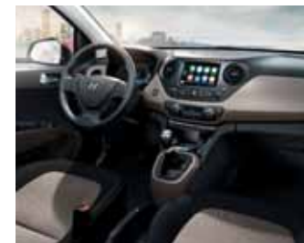
Černá / béžová