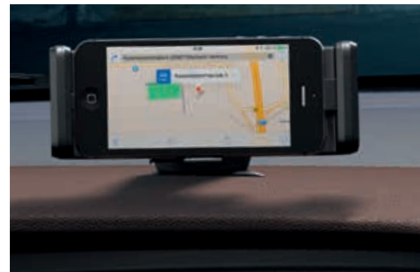
Dokovací stanice v horní části přístrojové desky. Nabízí bezpečné uchycení a nabíjení Vašeho chytrého telefonu.