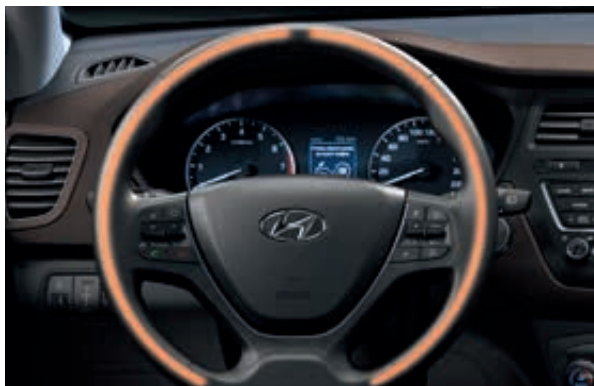
Vyhřívaný volant. Potěší Vás při odjezdu v mrazivém zimním ránu. Připojení prostřednictvím Bluetooth. Ovládací prvky na volantu pro bezpečné a snadné ovládání telefonu. S funkcí Bluetooth audio streaming budete mít také přístup ke své oblíbené hudbě.