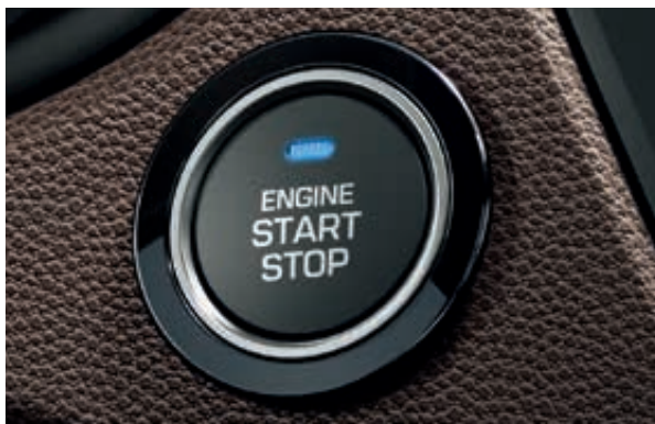
Startovací tlačítko. Bezklíčkové spuštění motoru, je-li chytrý klíček uvnitř vozu, ve Vaší kapse nebo třeba kabelce.

Pečlivě vybrané materiály vytvářejí v interiéru atmosféru vysoké kvality, která je v této třídě jedinečná. A v nabízené výbavě naleznete systémy a funkce, které překonávají očekávání v tomto segmentu. Mezi tyto výjimečné prvky patří i dokovací stanice pro chytré telefony v horní části přístrojové desky. Na dokonalém místě pro využití satelitní navigace nebo přehrávání oblíbených skladeb prostřednictvím audiosystému. Tento systém také může udržovat chytrý telefon v nabitém stavu.