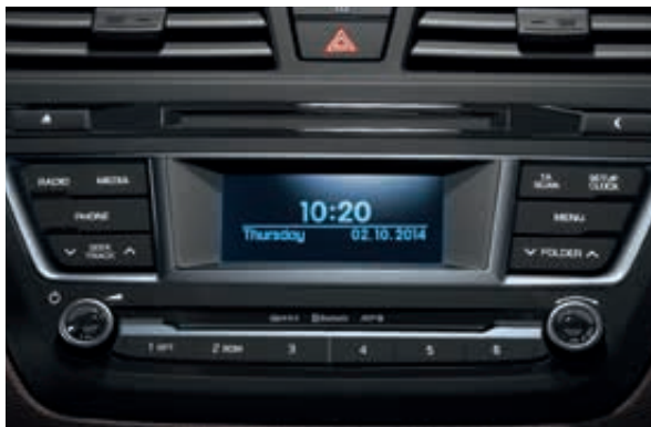
Audiosystém. Rádio RDS s přehrávačem CD/MP3. Systém lze ovládat také tlačítky na volantu.