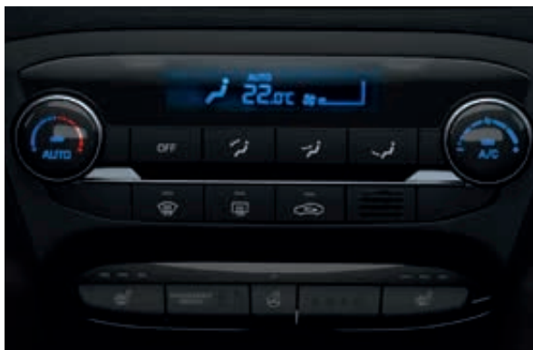
Automatická klimatizace. Nastavte si požadovanou teplotu a systém se postará o vše ostatní. K dispozici je dokonce i funkce automatického odmlžování, která udržuje okna dobře průhledná.