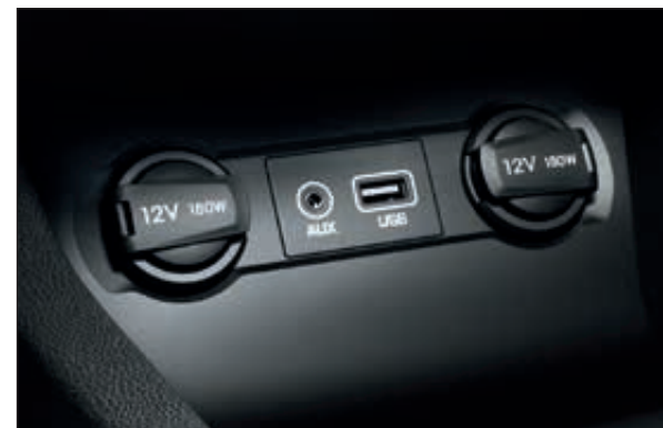
Vstupy AUX-In a USB. Snadné připojení pro chytrý telefon nebo přehrávač MP3. Přístroj připojte a můžete jej používat.