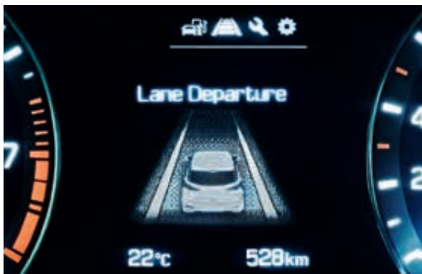
Asistent pro jízdu v jízdním pruhu. Okamžité vizuální a akustické upozornění na nechtěné opuštění jízdního pruhu.